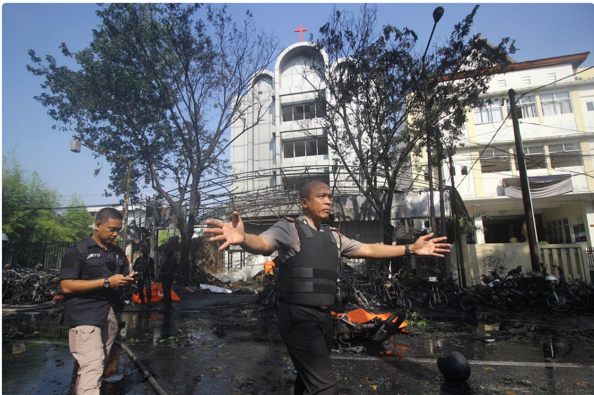
Polisi di depan Gereja Pantekosta Pusat Surabaya (GPPS), salah satu target pengeboman terorisme pada 2018.

“Strategi kontra-terorisme yang dapat dilakukan pemerintah dalam negeri meliputi beberapa aspek,” tambah Thomas. Di sini Thomas menekankan pentingnya insentif positif. Pemerintah harus memastikan bahwa kesejahteraan ekonomi masyarakat dapat terpenuhi.